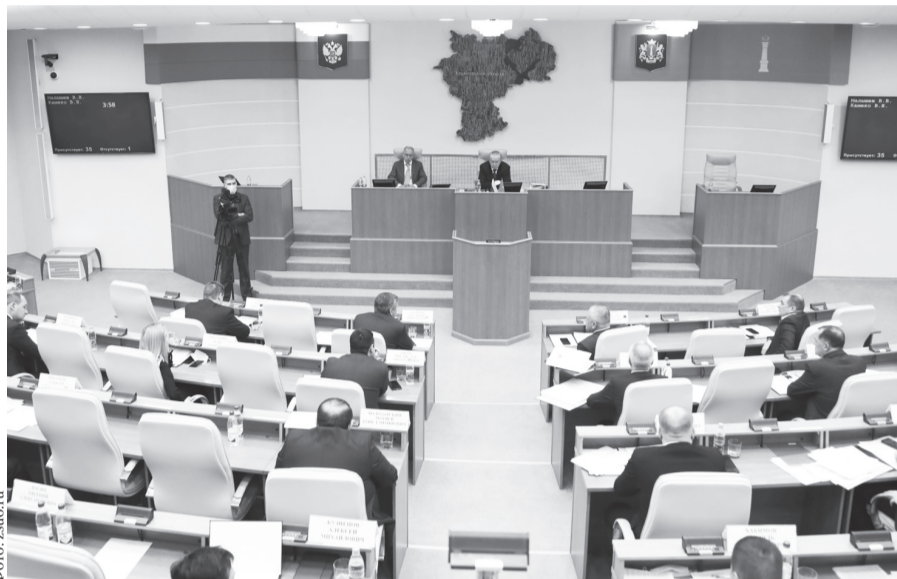
В первом чтении бюджет Ульяновской области на 2022 год был принят 10 ноября в ходе 48-го заседания Законодательного собрания VI созыва. Отметим, что впервые за много лет его поддержала фракция КПРФ, в итоге за проект проголосовали 32 депутата, один - против и трое - воздержались.

Предусмотрено и полное выполнение региональных обязательств по реализации национальных проектов, для чего заложено 12,7 миллиарда рублей. Значительные усилия направ-